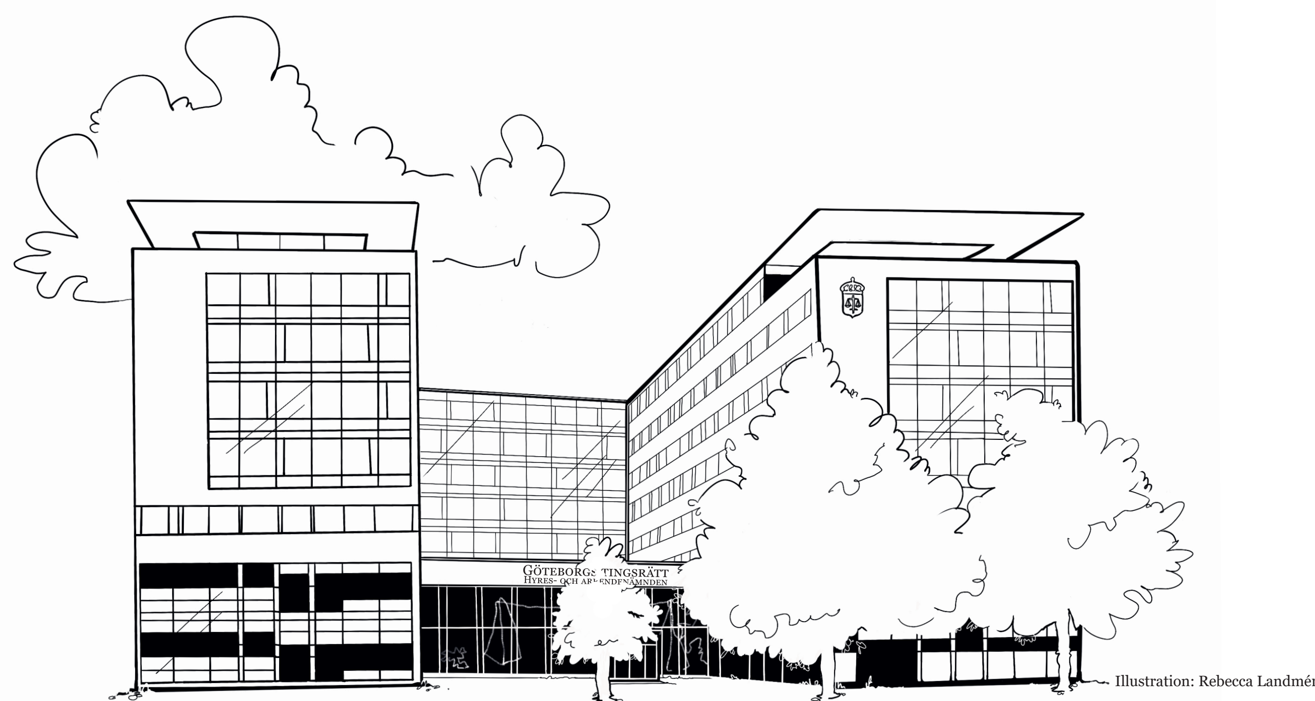
Illustration: Rebecca Landmér