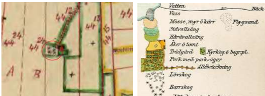
Bilder på del av Häradseconomiska kartan 1926-34 Sandhammaren (J112-3-91) och teckenförklaring, inskickade av länsstyrelsen.

dispensansökan avser utgörs av barrskogsbeklädd betesmark. Detta visas genom att trädgård enligt den häradseconomiska kartans teckenförklaring utgörs av en solid grön färg som omges med ett kompakt streck – på det sätt som ses söder och öster om byggnaderna – medan betesmark utgörs av en streckad linje med grön fyllnad och barrskog utgörs av ”stjärnor” – så som visas till väst om byggnaderna, se bilder nedan.