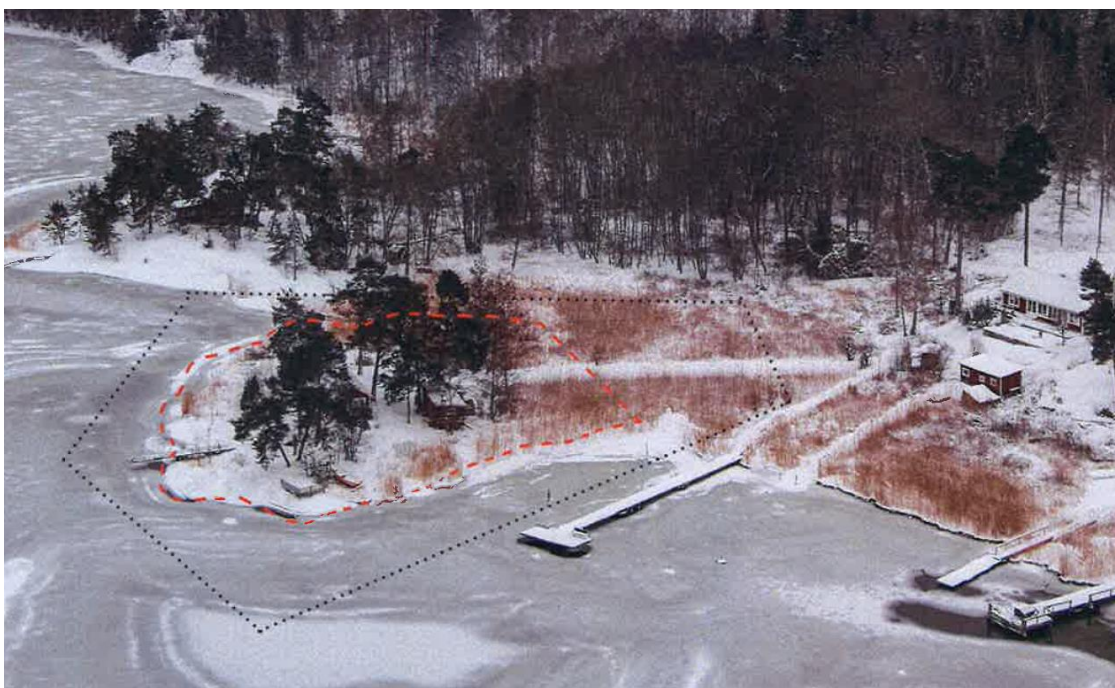
Fastigheten XX är markerad med svart, streckad linje. Stigen går genom den snötäckta passage där vassen slagits och fortsätter snett uppåt i bild, längs med villatomten på bildens högra sida.

På den plats där vägen ska anläggas finns i dag en stig som är ca 100 meter lång. Ungefär halva stigen går genom sankmark där det växer vass. Där löper den över en utfyllnad i marken som är ca 1,6 meter bred. Resten av stigen går över fast mark i ett relativt öppet område med enstaka träd, på ena sidan kantat av villabebyggelse.