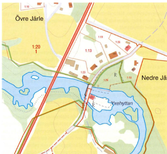
Figur. Fastighetskarta över området

Samtliga åtgärder i vatten och tillfartsvägar utförs inom Naturvårdsverkets egna fastigheter, A och E (tillträde enligt köpekontrakt den 6 april 2018), och dammanläggningen ägs av Naturvårdsverket. Naturvårdsverket har därför den rådighet som krävs för att genomföra de planerade åtgärderna. Naturvårdsverket har även rådighet enligt 2 kap 5 § lagen (1998:812) med särskilda bestämmelser om vattenverksamhet då det är fråga om åtgärder som är önskvärda från allmän miljösynpunkt.