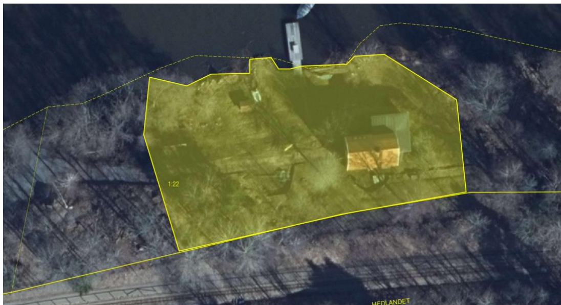
Nämndens beslutade tomtplatsavgränsning.

huvudbyggnaden tills nämnden bedömt att placeringen kunnat godtas. Av handlingarna i målet framgår vidare att tomtplatsavgränsningen i nämndens dispensbeslut är avsedd att överensstämma med det område som nämnden ansett utgör befintlig hemfridszon.