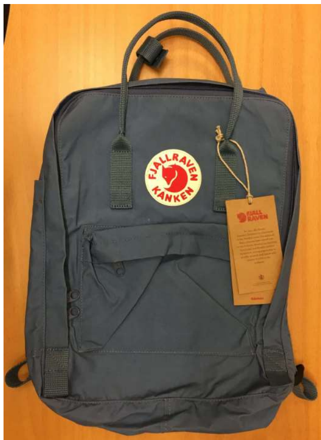
Utdrag ur aktbilaga 24 s. 2