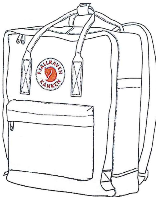
Utdrag ur aktbilaga 71