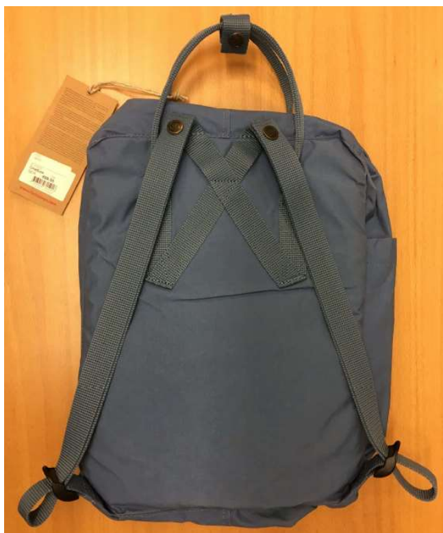
Utdrag ur aktbilaga 24 s. 3